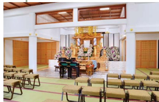
●本堂(36畳)約60席 ※祭壇は料金に含まれません。