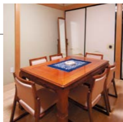
●客殿1階(6畳相当) 僧侶の控室としてご利用いただけます。