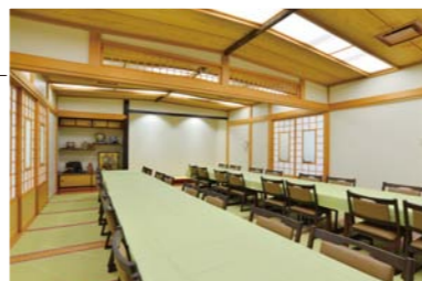
●客殿2階和室(24畳)約36席 (ご利用の際は別途料金がかかります。)