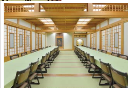
●客殿1階和室(39畳)約60席 仮眠にご利用いただけます。