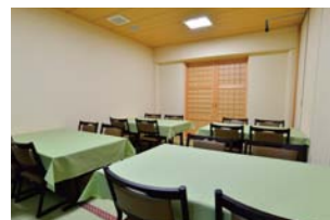
●本堂横(20畳)約20席 (ご利用の際は別途料金がかかります。)